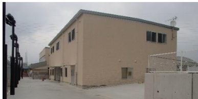
競輪場競技管理棟