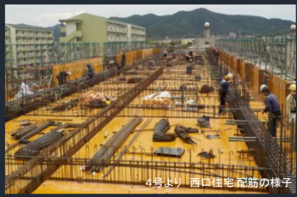
4号より 西口住宅 配筋の様子