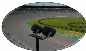
←豊橋競輪場に 新設したLED投光器