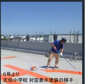
6号より 天伯小学校 対空表示塗装の様子