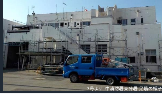
7号より 中消防署東分署 足場の様子