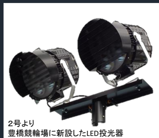
2号より 豊橋競輪場に新設したLED投光器