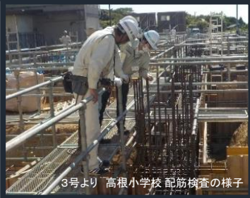
3号より 高根小学校 配筋検査の様子