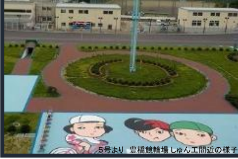
5号より 豊橋競輪場しゅん工間近の様子