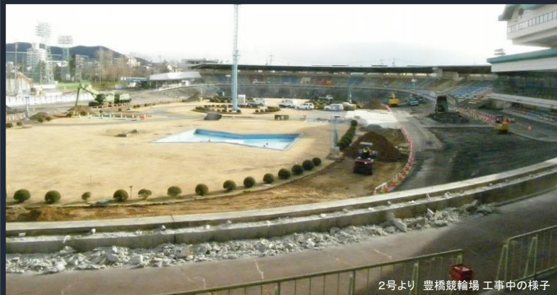
2号より 豊橋競輪場 工事中的の様子