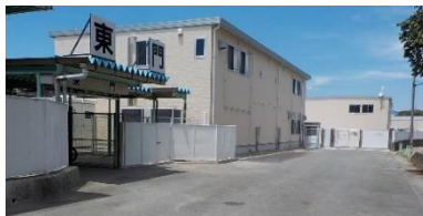
競輪場トレーニング室・会議室棟