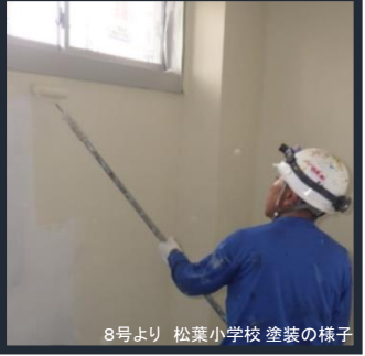
8号より 松葉小学校 塗装の様子

上の写真は、今までの「建築課タイムズ」に掲載してきたものです。工事中的の写真ばかりですが、しゅん工した物件もあります。次のページで詳しく見てみましょう！