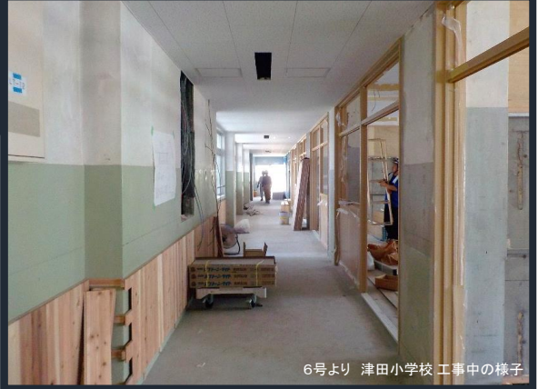
6号より 津田小学校 工事中的の様子