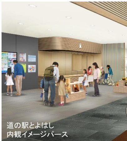
道の駅とよはし 内観イメージパース

休憩施設がにぎわいのある 空間となれば地域の核が形成され、 活力ある地域づくりや道を介した 地域連携の促進が期待される。 (文化教養施設、観光レクリエーション施 設などの 地域振興施設 )