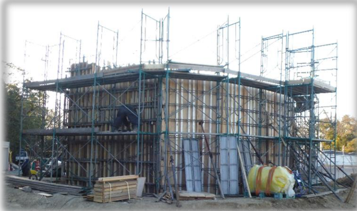
11月中旬ごろの様子。 コンクリートの中に埋める、基礎鉄筋を組み立てています。