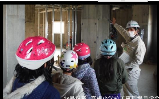
18号掲載 高根小学校工事現場見学会