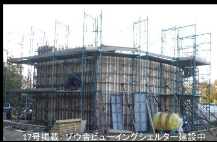
17号掲載 ソウ舎ビュウイングシェルター建設中