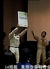
14号掲載 業務改善報告会