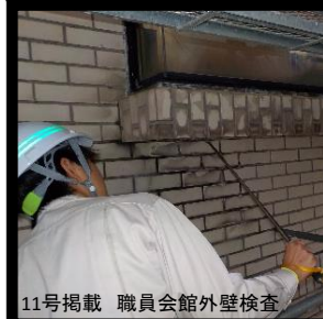
11号掲載 職員会館外壁検査