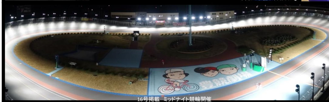
16号掲載 ミッドナイト競輪開催