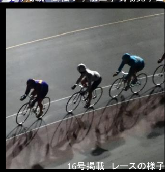
16号掲載 レースの様子