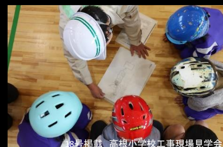
18号掲載 高根小学校工事現場見学会