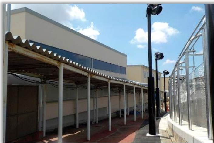
競技管理棟改修部分の外観 (競走路東側外周の通路から撮影)