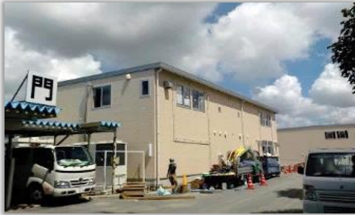
トレーニング室・会議室棟の外観 (東側入口から撮影)