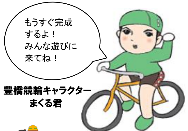
豊橋競輪キャラクター まくる君

( http://www.mlit.go.jp/jutakukentiku/index.html )