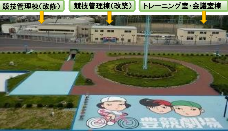
競輪場メインスタンドより撮影

7月28日(土)から30日(月)の3日間で、リニューアルイベントが開催され、241日ぶりにレースが再開されます!