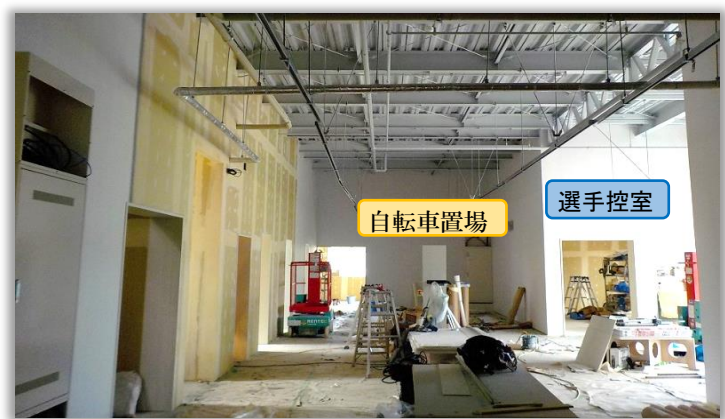
競技管理棟改築部分1階の様子。 自転車置場や選手控室などがあります。