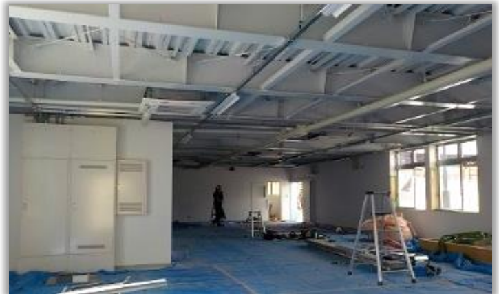
トレーニング室内の様子。 天井はあらわし(天井をはらないつくり)になっており鉄骨や配管類が見えます。