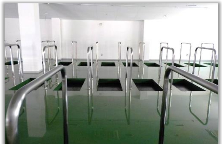
競技管理棟改修部分の1階にある選手練習場です。 練習器具は床の窪みに設置されます。