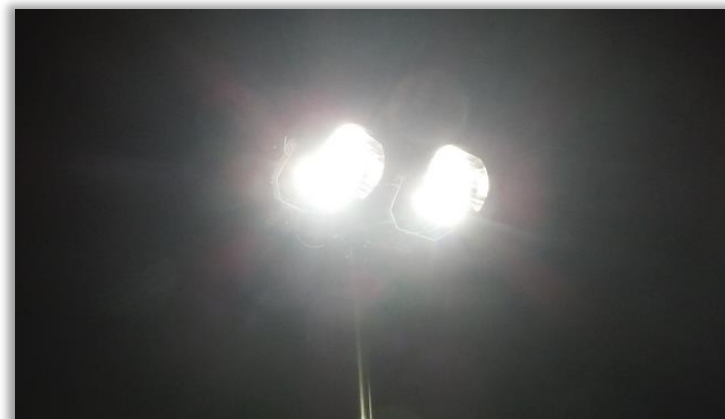
LED投光器を設置。省エネを実現しつつ、明るさの向上を図りました。