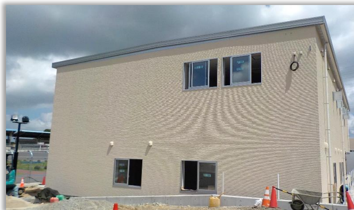
競技管理棟改築部分の外観 (東側入口から撮影)