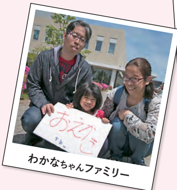
わかなちゃんファミリー