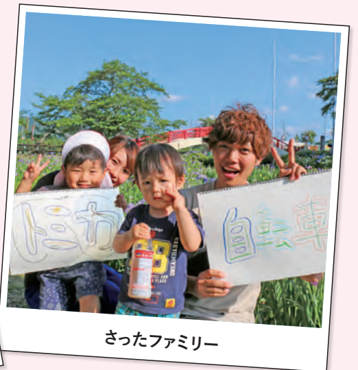
さったファミリー