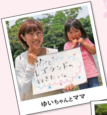
ゆいちゃん和妈妈

車掌って凄いと思いませんか! そんな車掌がバスから消えて随分年月が経ちました。車掌と運転手が、絶妙のコンビネーションで、軽快にバスを走らせていた姿が臉に浮かんできました。