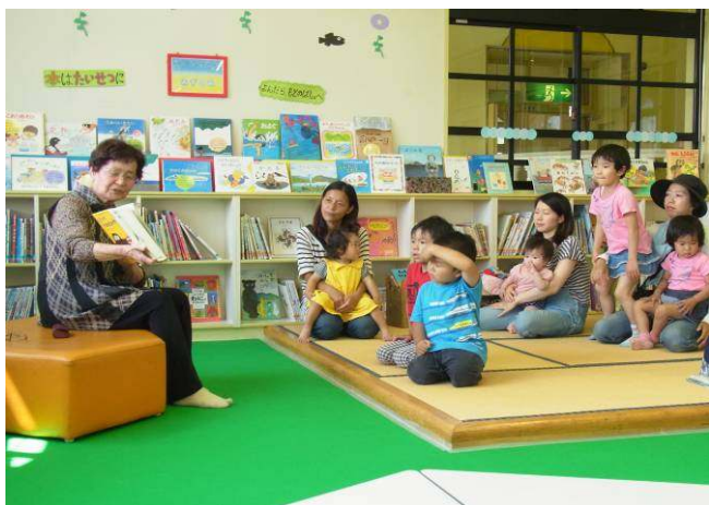
絵本の読み聞かせの様子