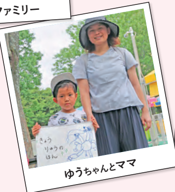
ゆうちゃんとママ