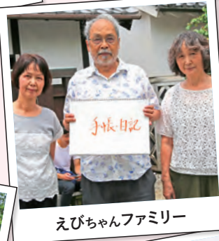
えびちゃんファミリー