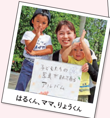
はるくん、ママ、りょうくん