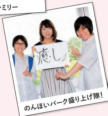
のんほいパーク盛り上げ隊!