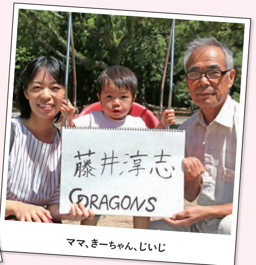
ママ、ぎーちゃん、じいじ