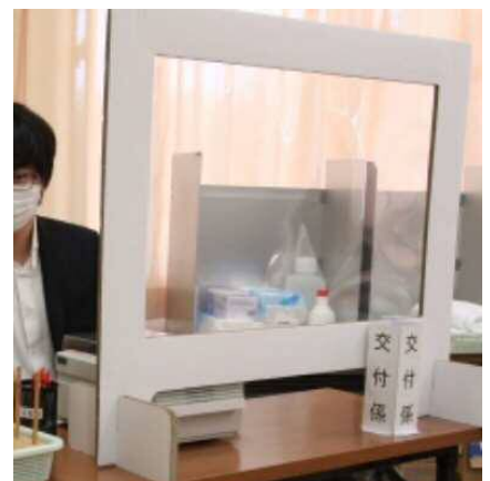
受付に必須となりつつある ダンボールパーティション

避難者が生活するスペースも、 ダンボール間仕切り や、 テント型の間仕切り 、床面で生活するリスクを考慮し、 寝台 や ダンボールベット などで高い位置をキープする。隣との距離を保つため、避難所の 収容定員はより少なく する必要があります。よって別途 教室の開放 も余儀なくされます。どの教室から解放するべきか。学校の施設管理者である、 先生との話し合い も必要となります。今まで以上に考える事が多い印象です。これからも避難所開設訓練の際に、感染症対策を取り入れるとともに、より多くの地域の方への周知をしていく必要性があると思います。