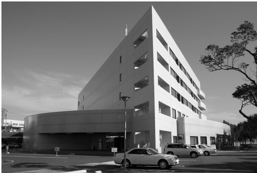
「豊橋サイエンスコア」