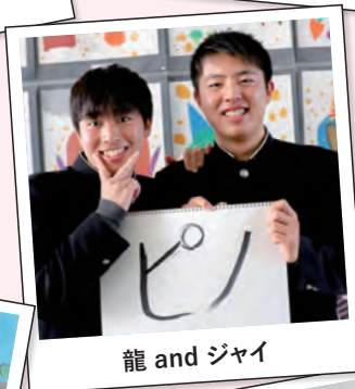
龍 and ジャイ