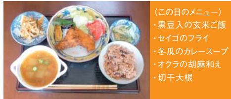
〈この日のメニュー〉 ・黒豆入の玄米ご飯 ・セイゴのフライ ・冬瓜のカレースープ ・オクラの胡麻和え ・切干大根

手しごと屋豊橋では週替わりで、自由に裁縫を楽しむ「ちくちく講座」や料理講座、将来の不安解消勉強会、エンディングノートの書き方、介護予防健康体操などの講座を開催しています。どれも会員の特技を活かしたものであったり、興味・関心を持っていることが企画になります。もちろん、会員が企画立案します。講師については、企画した会員自身が担当したり、会員の人脉やネットワークを通じて依頼したり、自分たちが本当にしたいことを、自分たちの出来る範囲で実行しています。この日はバザーなどで販売する作品づくりが行われました。皆さ