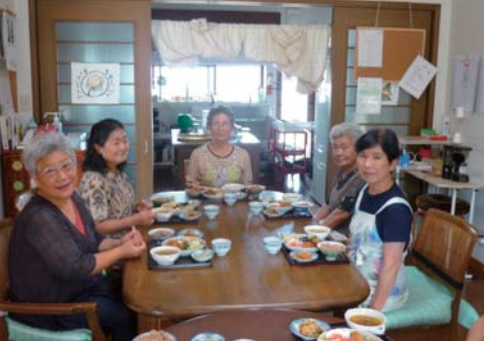
おいしいランチに自然と笑顔に。

手芸や料理教室、健康体操といった各種講座をはじめ、玄米菜食交流会、市民活動への参加など、幅広い活動を行っているコミュニティカフェ「手しごと屋豊橋」グループ設立から現在までの経緯や活動の目的、会員の方々の想いなど、お話をうかがいました。