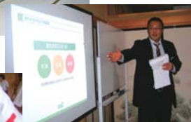
家族葬についての講座