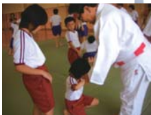
特別支援学級の子どもたちと柔道教室