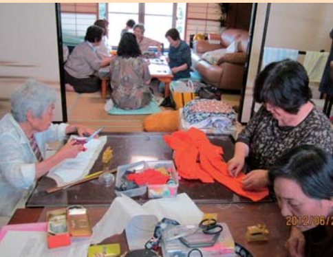
自由に裁縫を楽しむ「ちくちく講座」