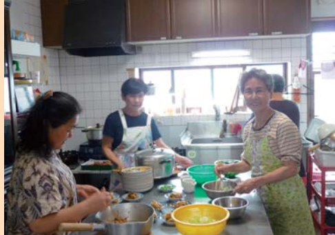
笑顔あふれる「ふれあいランチ」づくり