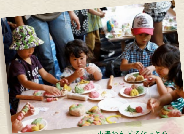
小麦ねんどでケーキを 作りました。