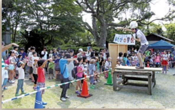
みんな楽しく体操しよう♪