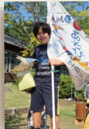
あそびのチャンピオンには 賞状と優勝旗を贈呈。