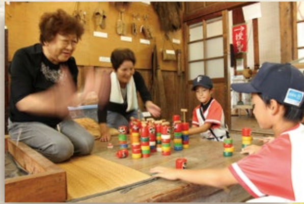
だるま落として結構難しいんだね。