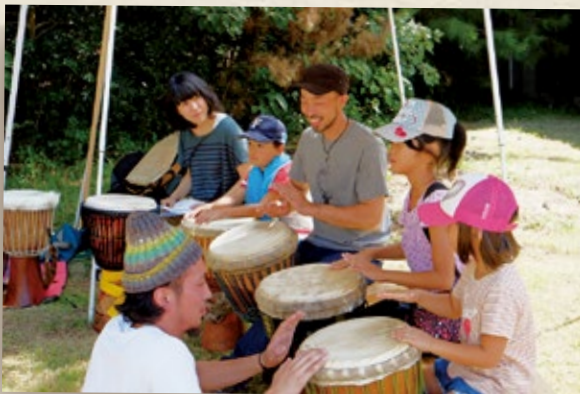
西アフリカの不思議な太鼓でリズムに合わせて♪