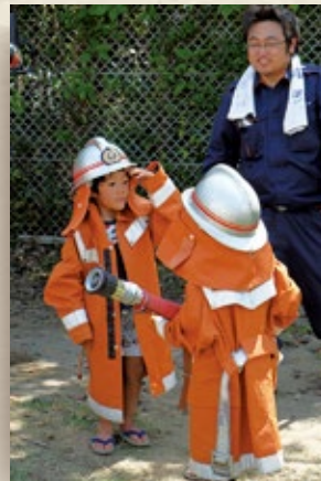
消防服着ていっちょ前！