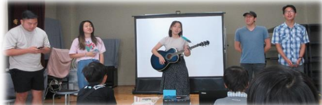
👉アメリカ人留学生さんによる英語の生歌披露！