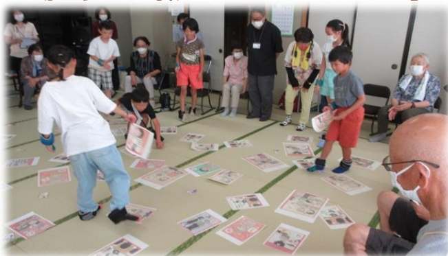
👉仁連木・東郷寿会のみなさんとカルタ大会