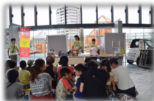
③おもちゃを並べて展示