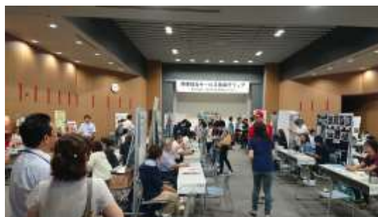
事業所フェアの様子

実施日：平成30年8月11日（祝） 12：00～16：00 場 所：ほいっぷ講堂、ロビー他 参加事業所：38事業所 （内リーフレットのみ設置 16事業所） 来場者数：おおよそ200名