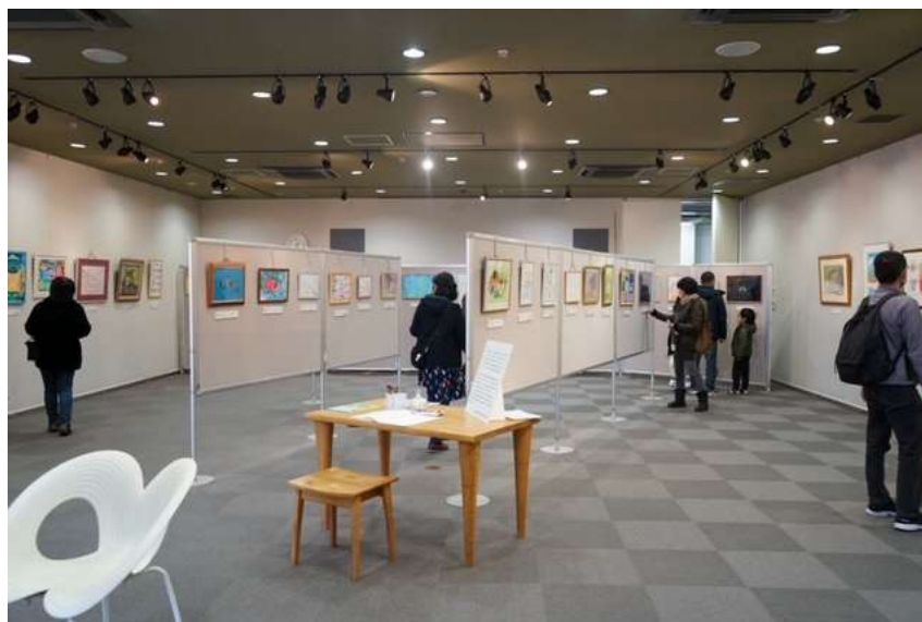
障害者週間イベントの絵画展の様子