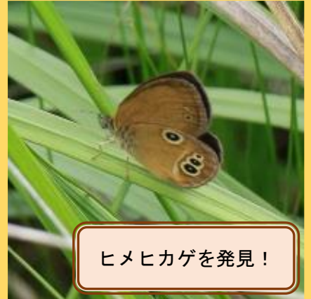
ヒメヒカゲを発見！