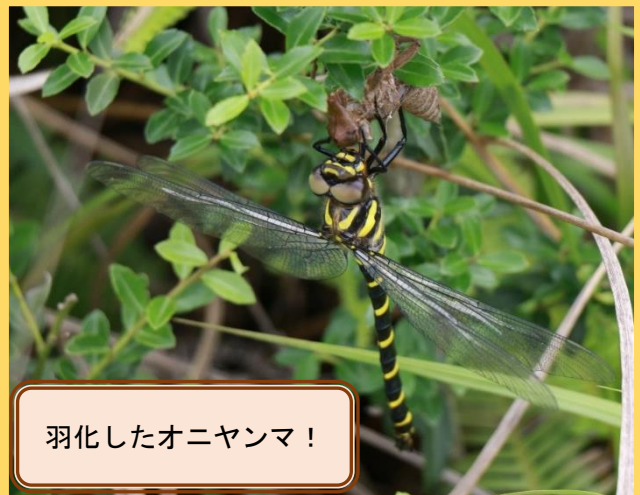
羽化したオニヤンマ！