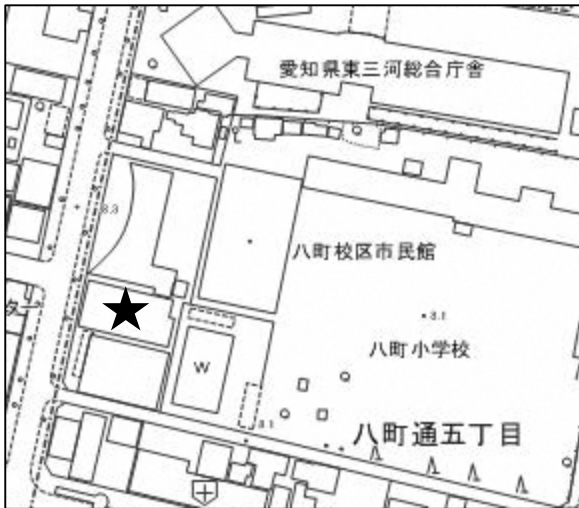
豊橋市八町地域福祉センター