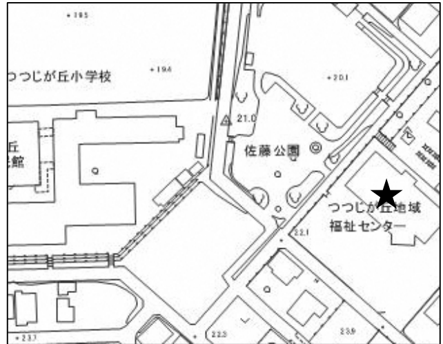
豊橋市つつじが丘地域福祉センター