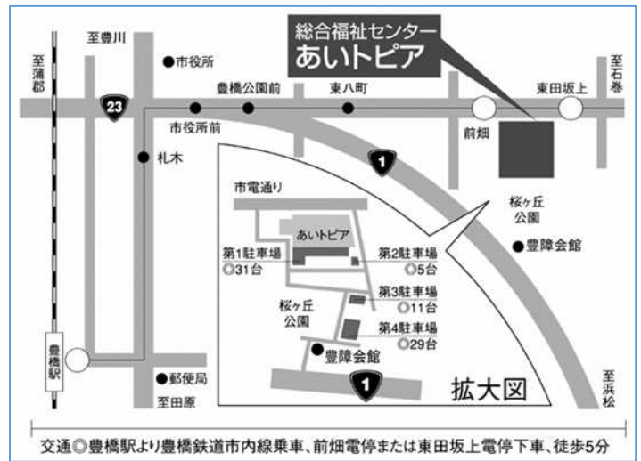
豊橋市総合福祉センターあイトピア