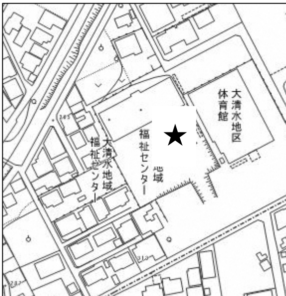
豊橋市大清水地域福祉センター