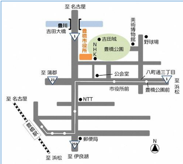
豊橋市役所子育て支援課（市役所東館 2階）