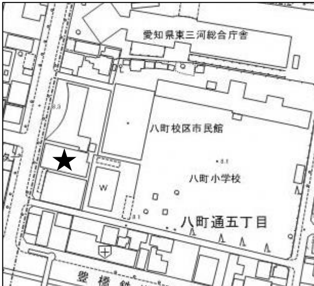
豊橋市八町地域福祉センター