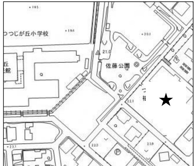
豊橋市つつじが丘地域福祉センター