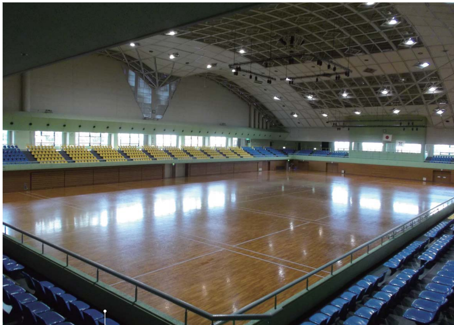
第1競技場 広さ 3,450 m 2

豊橋市総合体育館は、豊橋総合スポーツ公園にある総合体育施設です。 第1競技場は3,000席の観客席を備えており男子プロバスケットボール、女子バスケットボール・バレーボールリーグ公式戦を開催しています。