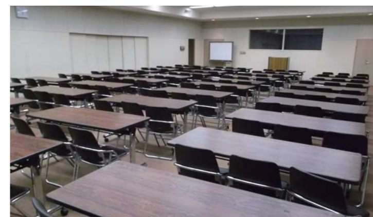
研修室 (202m 2 ) スクリーン、放送設備有