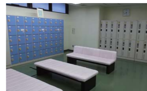
更衣室(男女各2室) ・ロッカー計120個(男女各60個) ・シャワー計10基(男女各5基)