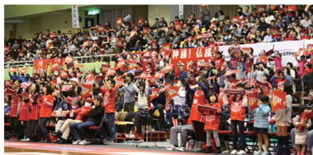
第2競技場 広さ 1,178 m 2

・延床面積1,178㎡(約36m×約32m)。天井高13.5m。 ・バレーボール2面、バスケットボール2面、バドミントン6面、卓球台16台設置可