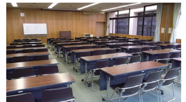
第1会議室 (160m 2 )・第2会議室 (115m 2 ) スクリーン、放送設備有