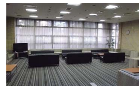
ロビー ミーティングスペース有