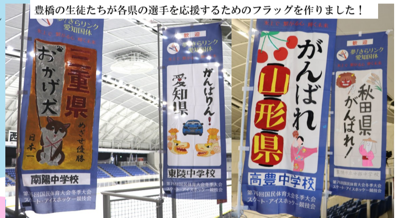
豊橋の生徒たちが各県の選手を応援するためのフラッグを作りました！