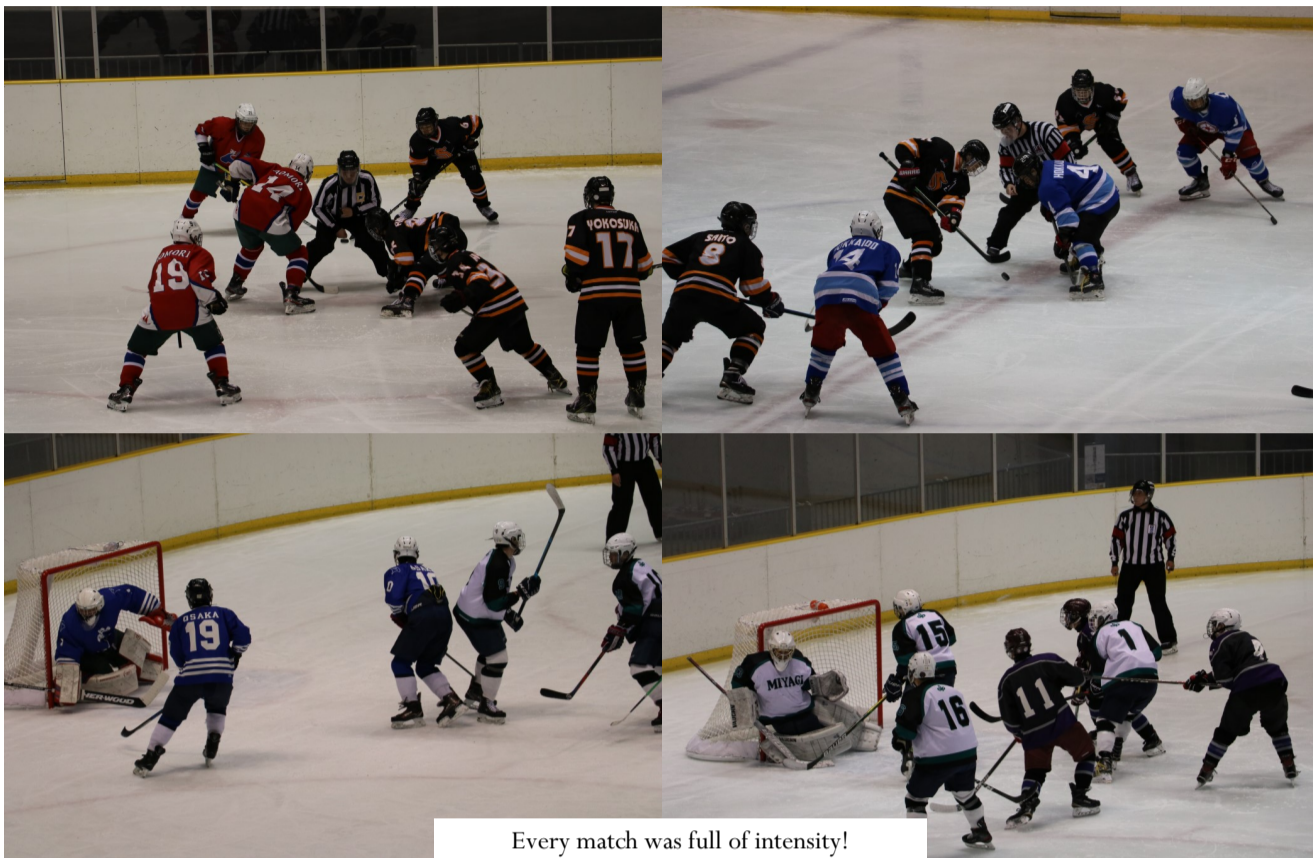
Every match was full of intensity!

From January 27th to the 31st, the Japan National Sports Festival's ice hockey tournament was held at Aquarena Toyohashi. Toyohashi played host to the junior division tournament, as well as a few early matches from the senior division. The tournament featured the best ice hockey athletes from around the country, each representing their respective prefectures. The athletes put on a display of power, speed, and incredible teamwork. On the 27th and 28th, teams from Okinawa to Hokkaido showed Japan's passion for ice hockey. The 29th featured the quarter final matches for the junior division. It was a demonstration of incredible teamwork and overwhelming offensive play from the veteran teams. The semi-finals took place on the 30th, with