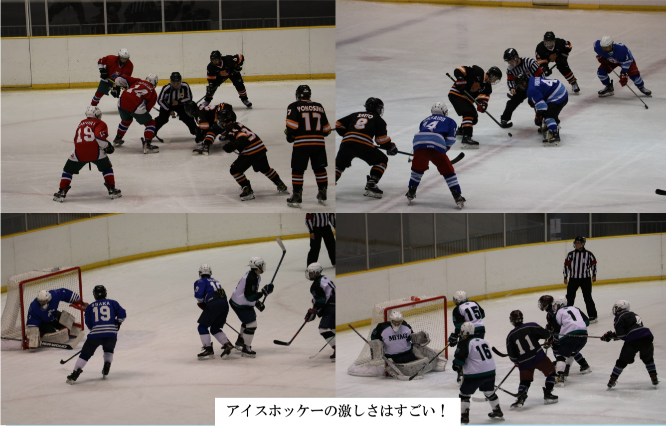
アイスホッケーの激しさはすごい！

1月27日から31日にかけて、アクアリーナ豊橋で第76回国民体育大会冬季大会アイスホッケー競技会を開催しました。豊橋市では少年の部と成年の部の一部の試合が行われました。厳しい予選で勝ち抜いた都道府県の選抜プレイヤーらがスケートの能力、パワー、スピード、そして最高のチームワークを披露してくれました。27日と28日には少年と成年の1回・2回戦が行われ、沖縄から北海道まで、全国のアイスホッケープレイヤーの情熱を感られる熱戦が繰り広げられました。29日には少年の準々決勝が行われました。囲まれたときは必ずパスができるチームメートがいるようなチームワークや、相手ゴールキーパーに息もつかせない連続シュートの攻撃など、強豪チームの強さがどんどん現れてきました。30日の準決勝は北海道対宮城県、埼玉県対東京都という強豪同士の組み合わせでした。北海道と宮城県の試合は4対3で北海道が勝ちましたが、どちらが勝ってもおかしくない素晴らしい試合でした。次の試合は強豪の埼玉県が東京都を7対1と圧倒しました。その結果、決勝戦は北海道対埼玉県となりました。前半は埼玉県が3対2で勝っていましたが、後半に北海道が2ゴールを決めて、アイスホッケー競技会少年の部第1位となりました。選手の皆さん、お疲れ様でした！アイスホッケーが好きな方、またはアイスホッケーってどんな競技か見てみたいという方はオンラインで少年の部・青年の部の全試合がご覧になれます！「国体チャンネル」で検索してください。また、アイスホッケーのルールについて知りたいという方は下のQRコード先の「豊橋CIR」ページで紹介していますので是非ご覧ください。