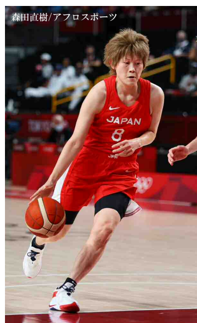
Tokyo 2020 Women's Basketball silver medalist Maki Takada