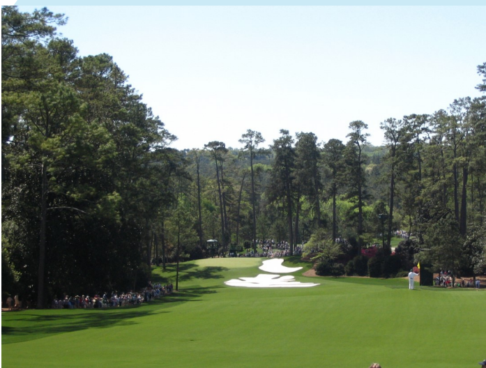
オーガスタ・ナショナル・ゴルフクラブ

11月12日～15日、米ジョージア州にあるオーガスタ・ナショナル・ゴルフクラブでゴルフ4大大会の一つ、マスターズトーナメントが開催されました。例年4月に開かれますが、新型コロナウイルス感染症拡大のため延期となりました。無観客の静かな雰囲気、タイガー・ウッズ、全米オープン優勝者のブライソン・デシャンボー、日本の松山英樹など、世界トップの選手が努力しましたが、世界ランキング1位のダスティン・ジョンソンが全く違うレベルでプレーして、5打差で勝ちました。ローアマチュア（スコアの最も低いアマチュア）は34位タイで終わったアンディ・オグルトゥリーに与えられました。