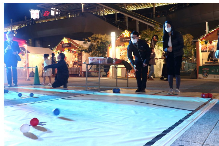
An intense boccia showdown!

The Germany & Lithuania PR Fair was held from November 13th - 15th at Toyohashi Station. Many of the visitors had the chance to experience another sport exclusive to the Paralympics, boccia. To play boccia, a white ball is first thrown down the court. The goal of both teams is to throw their balls as close to the white ball as possible, and keep their opponent’s balls as far away as possible. At the end of each round, or “end,” the team with the closer ball is the winner, and each ball closer than their opponent’s closest ball is worth one point. Boccia was created for athletes with motor disabilities, but it can be enjoyed by absolutely anybody! If you ever have the chance, give it a try!