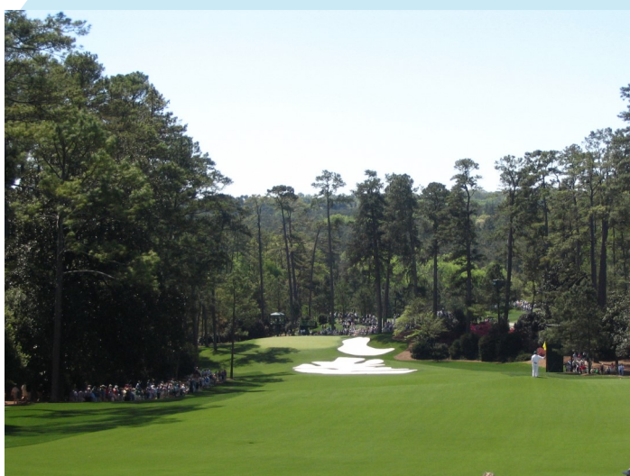
Augusta National Golf Club