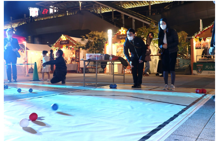
ボッチャに熱心な方たち

11月13日～15日にドイツ・リトアニアPRフェアを開催しました。多くの方がパラリンピックの競技、ボッチャを体験しました。ボッチャとは赤チーム対青チームで白い的玉に相手よりボールを近づけることを目的とする競技です。エンド（回）が終わった後、最も近くにボールがあるのが勝ちチームのなり、負けたチームの最も近いボールよりさらに近い勝ちチームのボールが各1点として数えられます。エンドを数回繰り返して点数を競います。ボッチャは運動能力に障がいを持った選手のために考案されましたが、誰でも楽しく参加できるスポーツですので、皆様、ぜひ機会があればプレーしてみてください！