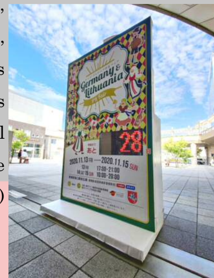
Counting down the days to the event!