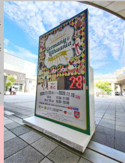
豊橋駅南口駅前広場でイベントまでの日数を数えているカウントダウンボード