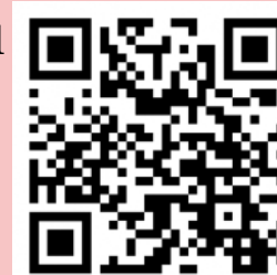
More details here! (Japanese only)

Where: Toyohashi Station South Entrance Pavilion (near the Atsumi Line entrance)