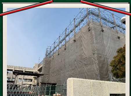
飯村小学校仮設の様子 (4月27日)