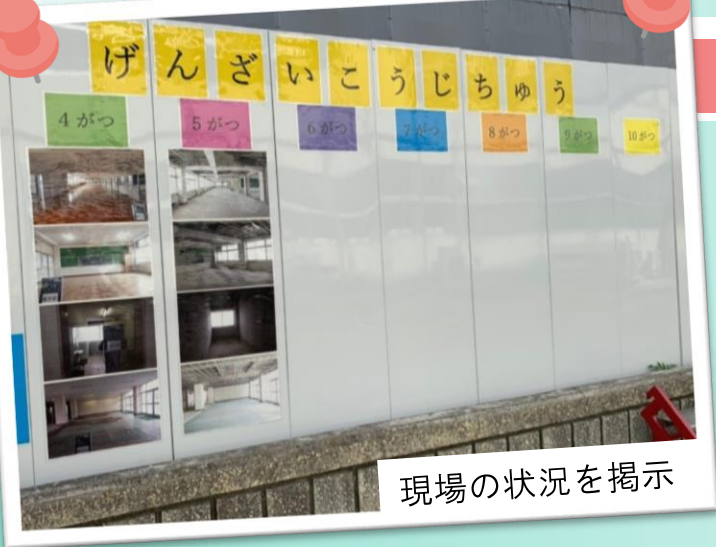
現場の状況を掲示