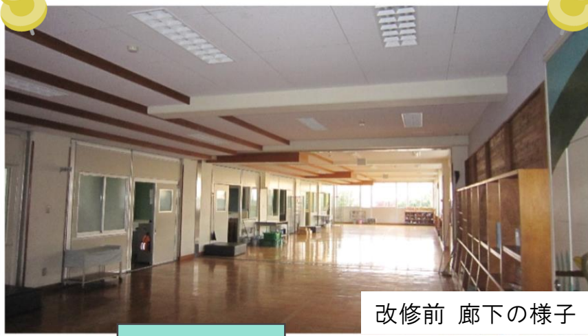
改修前 廊下の様子