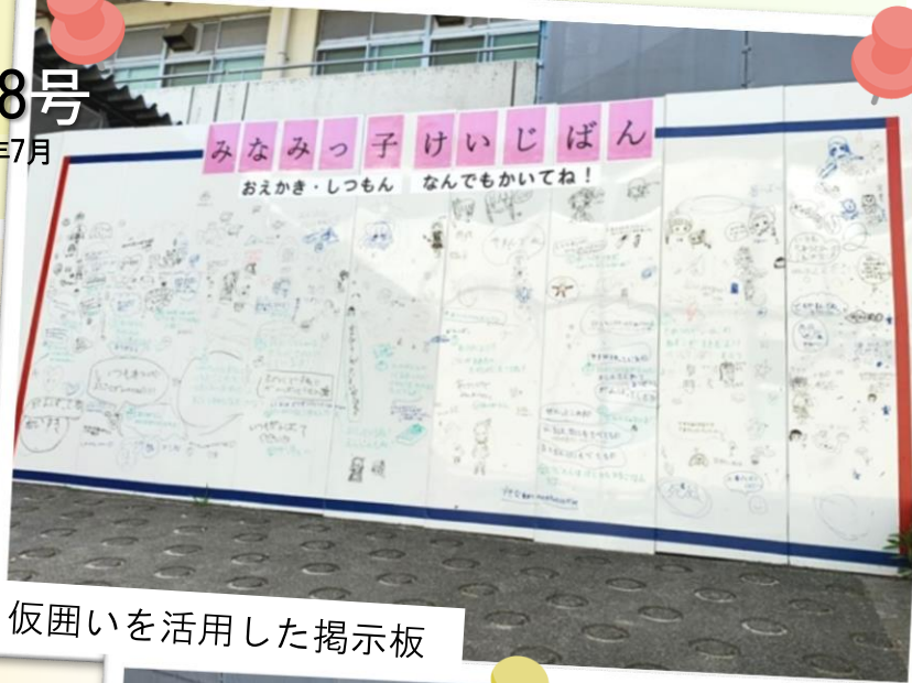
仮囲いを活用した掲示板

むむ、これはスクープのにおい・・・✦ そこで私たちタイムズ編集者は、現場所長に突撃インタビューをしました。