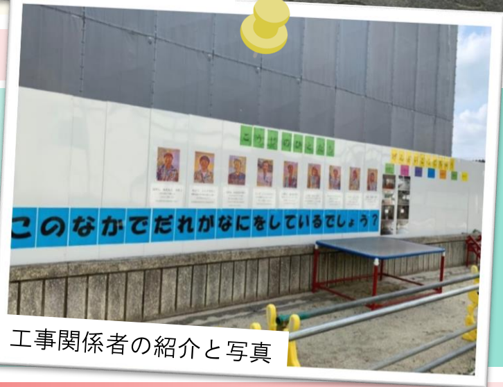
工事関係者の紹介と写真

A. 建築業界のイメージアップにつながればという想が一番ですかね。「工事」＝「騒がしい・邪魔・迷惑」といったマイナスのイメージがつきものなので・・・(笑) 実はこの掲示物、楽しい雰囲気を出せたらと手作りしたんです。僕ら建築の仕事に子どもたちや施設の方に少しでも興味や親しみをもってもらえると嬉しいなあ、と思ひまして。