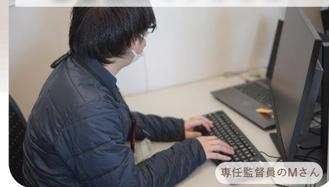
専任監督員のMさん