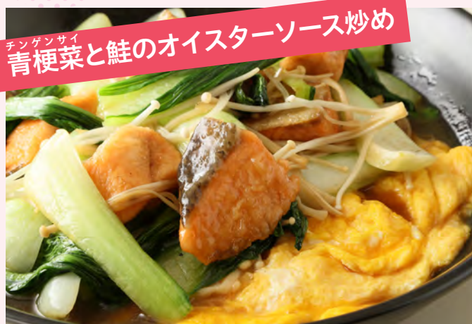
チンゲンサイ 青梗菜と鮭のオイスターソース炒め