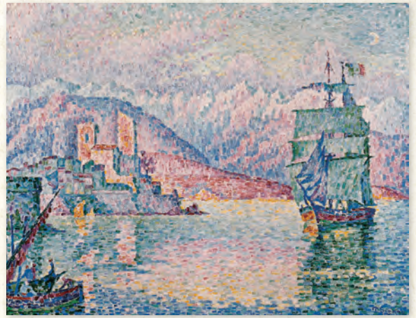
ポール・シニャック「アンティープ、夕暮れ」1914年 Musée d'Art Moderne et Contemporain de Strasbourg, Photo Musées de Strasbourg.

アンリ・ド・トゥールーズ=ロートレック「ディヴァン・ジャポネのポスター」1892年 Musée d'Art Moderne et Contemporain de Strasbourg, Photo Musées de Strasbourg.