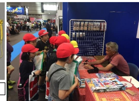
超音波カッター体験会を実施