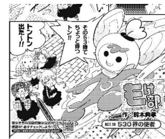
530運動コラボレーション