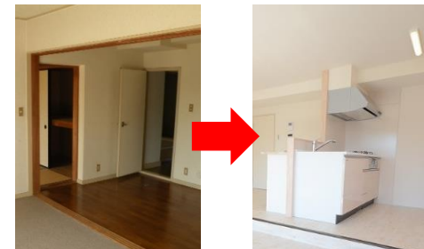
■気持ちよく生活ができるための物件リフォーム