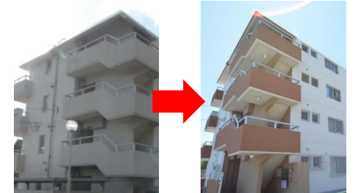
■管理物件内の建物修繕提案→結果