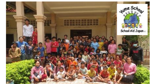
■School Aid Japan現地の子供たち