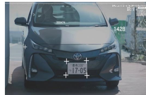
● 車番認識システムの開発