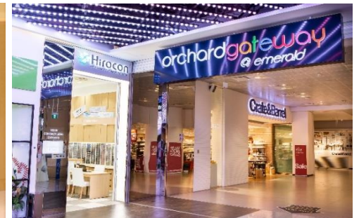
● シンガポール店との交流