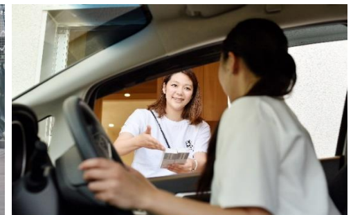
● 業界初コンタクトレンズドライブスルーの実現