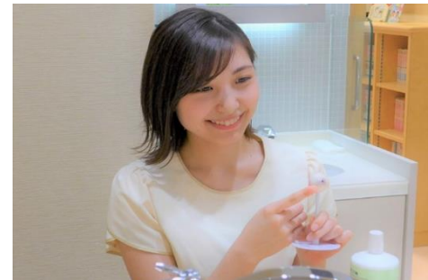
● コンタクトレンズの装用指導

「安心の正しいコンタクトレンズ販売」をモットーに地域のお客様から愛される店舗を目指し事業に取り組んでいます。創業以来、とくに接客力の向上に力を入れており、「HIROCONの接客は日本一」と評されることが目標です。地元豊橋のお客様に支えられ35年。地域の方々の健康・安全をテーマにコンタクトレンズを通じて「見える喜び」を提供しています。また、当社の理念は、仕事を通じて自分を成長させること。会社は社員のためにあり、社員の誰もが主役です。そんな思いから社員の資格取得支援、ボーナス休暇制度や海外事業部への留学制度、女性が長く活躍できる社会の実現、そして次世代を担う子供たちへの支援等、様々な分野での「成長」を大切に活動をしています。