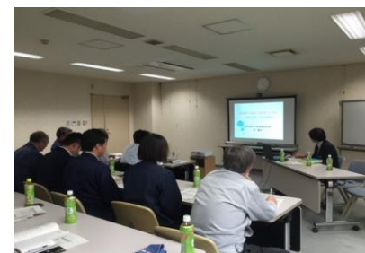
■ 組合員に向けて法令勉強会や情報を提供します。