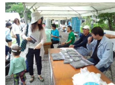
■ 530のまち環境フェスタにてリサイクル品の配布