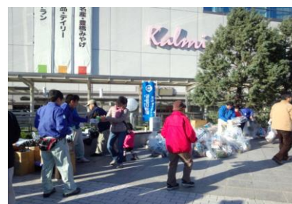
■ クリーンアップ大作戦に参加しています。