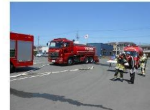
地域一体型消防訓練