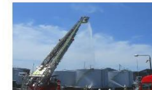
地域一体型消防訓練