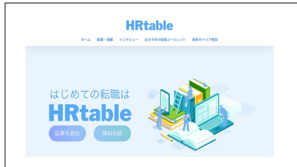
転職・キャリアの情報メディアHRtable

株式会社かけるは、「転職エージェント事業」及び転職の専門家・プロの知見を活かした情報サイト「HRtable」「保育士転職more」「MIRAISTEP」を運営するなど、転職・キャリア領域に特化した事業展開をしています。