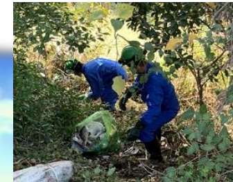
■ 不法投棄撤去作業に参加