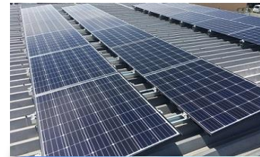
■ 社屋屋根に設置された太陽光パネル

弊社は1975年6月に設立し産業廃棄物処理業として適正且つ確実な業を続けてきました。東三河を中心とした地域密着型企业だからこそ出来る“人との繋がり”を活かしたやさしい環境づくりに取り組んでいます。排出事業者より排出される産業廃棄物をネットワークを通じ、減量化・再資源化・再燃料化などの再生可能エネルギーへと生まれ変わるご提案をさせていただいております。「お客様第一」「安全第一」「環境第一」を掲げお客様、地域の皆様と共に環境保全、循環型社会の形成を目指します。2002年2月ISO14001を認証取得以来、環境マネジメントシステムのもと環境負荷低減への活動を実施し継続的改善に努めています。また最近ではSDGsに賛同し、廃棄物処理を軸に課題の解決に向けて、持続可能な明るい未来を応援します。