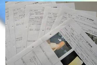
■ 様々な発想の「業務改善提案書」