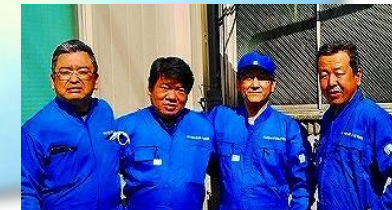
■ 外国人の社員さんと共に生き生きと働ける職場環境