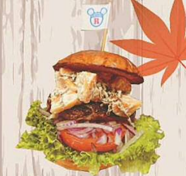
RAD LAND PICNIC 次郎柿バーガー 1,000円