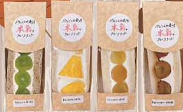
パティスリーモリ パティシエが創る「本氣」のフルーツサンド ～秋のフルーツサンド～ 500円～