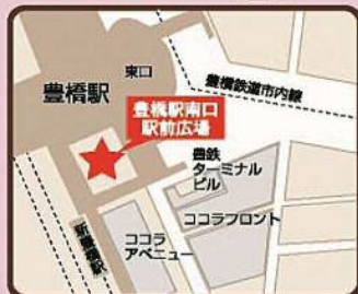
豊橋駅南口駅前広場 (豊橋鉄道渥美線新豊橋駅前)