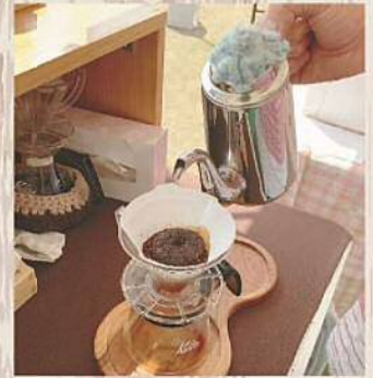
自家焙煎凡々豆珈琲 ブレンドコーヒー 400円