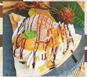
moving resort Café de BOSSA マロン・ド・ショコラ 680円