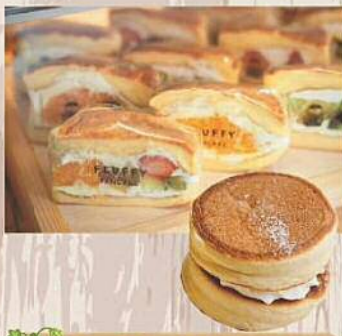
パーラー HANAKO パンケーキサンド 380円～