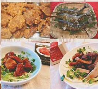
設楽特販 シカのから揚げ 350円 鮎塩焼き 400円 鹿肉の缶付け(コシファイ状和風) 1,000円