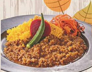
LAWDY CURRY キーマカレー 800円