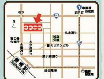
こども未来館 ここにこ 芝生広場