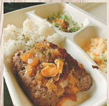
Liberty Kitchen ハンバーグプレート 1,000円