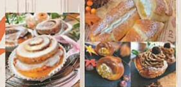
1(日)のみ ベーカリーショパン