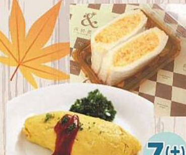
たまごとお オムライス 850円 たまごサンド 350円