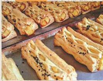
PABRATA.10 スイーツポテトパイ 250円