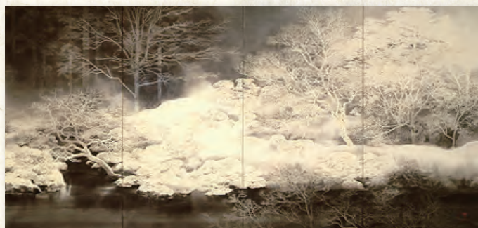
平川敏夫「雪后閑庭」(右隻)1985年