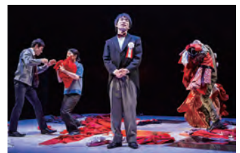
2016年 木ノ下歌舞伎「義経千本桜-渡海屋・大物浦-」