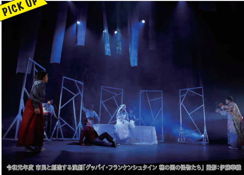
令和元年度 市民と創造する演劇「グッバイ・フランケンシュタイン 穂の国の怪物たち」