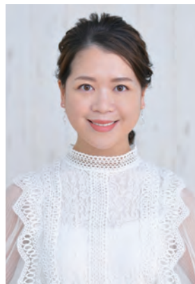
プロフィギュアスケーター 鈴木 明子さん

鈴木 明子さんからコメントをいただきました。 新型コロナウイルス感染症拡大により、開催が1年延期となった東京2020オリンピック。昨年は世界中の人々の日常や生活様式が大きく変わりました。 聖火ランナーとして、世界の皆さまの心の中まで、少しでも明るく照らす聖火を運ぶことができたらと思います。私自身も摂食障害により、大好きなフィギュアスケートから離れざるを得なくなり、絶望の中で悩み苦しんだ時期がありました。そんな時でも周囲の方々から支えられて、一つ一つ、少しずつ時間をかけて調整して、壁を乗り越えてきました。聖火ランナーを務め、誰かの希望となることで、これまで優しく声を掛けてくださり、勇気やたくさんの励ましの言葉、元気を頂いた方々への恩返しができたらと思います。