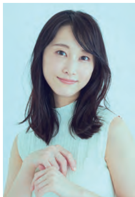
女優 松井 玲奈さん