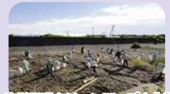
汐川汚濁クワシシアツプ大作戦

530運動などの美化活動の促進や、監視パトロールなどにより不法投棄の防止を進めます。