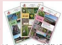
ネイチャースポット探検記録の配信

市内に生息する動植物などの環境情報収集や調査研究を進めるとともに、広報誌など多様な媒体を活用し効果的に環境情報を発信します。