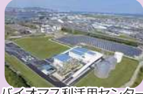
バイオマス活用センター

地域資源回収などリサイクル推進体制を充実するとともに、豊橋市バイオマス活用センターなどでのバイオマスの利活用を進めます。