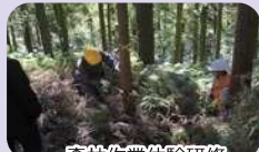
森林作業体験研修

雨水利用など水資源の有効利用を進め、広域連携により豊川上流域の水源林の保全などに取り組みます。