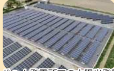
E-じゃん発電所での太陽光発電

地域新電力事業によるエネルギーの地産地消や、市の保有施設などでの「再生可能エネルギー利用100%」を進めます。