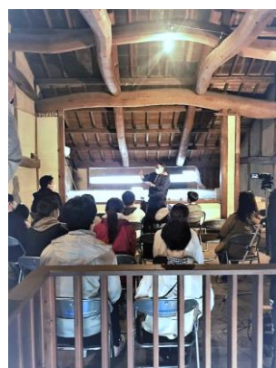
左上: 三ツ田屋の正面夜景 右上: 敷地の奥にある珍しいレンガ造の蔵 左中: 学生参加の清掃 左下: 親子で土壁塗りのワークショップ 右下: 主屋2階での学習会