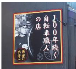
上: 景観整備したお店