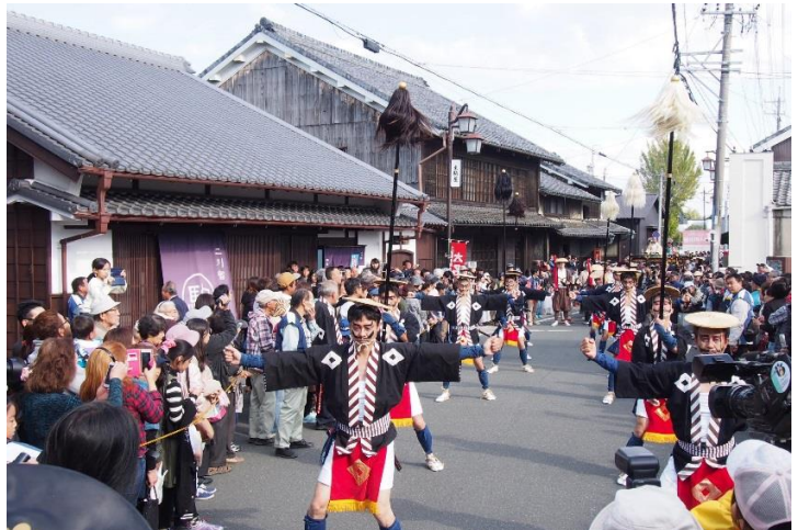
▲商家「駒屋」前での奴踊り。旧街道は見物客で大賑わい！

来訪者の方々から、「毎年来るけど、来るた びに良くなっているね！」、「いい写真が撮 れるようになった！」、「住民が皆で協力を しているのがすごい！」といった沢山の声 が聴かれました。