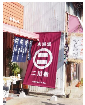
▲ 3枚の日除けのれんは、それぞれ、藍色、からし色、紅色と日本の伝統的な色で染め、宿場町の風情を高めています。