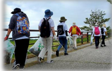
▲聖火リレールートクリーン隊