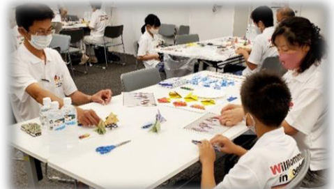
▲ドイツ体操チームを手作りのお土産でもてなし隊