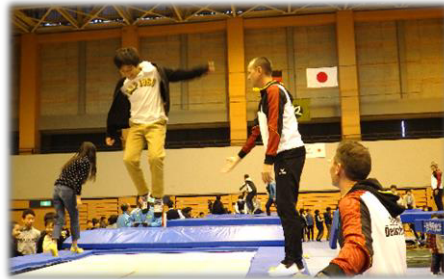
▲ドイツトランポリンチームと市内小学生との交流