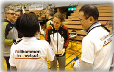
▲ドイツトランポリンチーム合宿サポート隊

上越市では、オリンピックやドイツに関心を持っていただくため、2019年10月から「上越市ホストタウンサポーター」の募集を開始しました。2021年6月30日現在、126名・1団体が登録されています。市では月1回程度、「ホストタウンサポーター通信」を発行し、ホストタウンの取組、オリンピック・パラリンピックやドイツに関する情報を提供しているほか、サポーターの皆さんには「サポーターズアクション」として、ドイツチームの合宿サポートや交流活動に参加してもらっています。