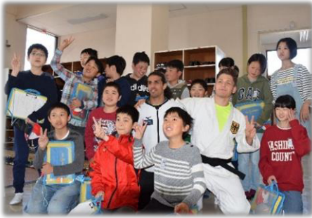
▲ドイツパラ柔道チームと市内小学生との交流