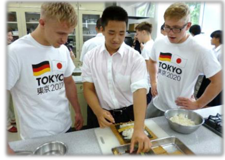
▲ドイツパラ柔道チーム(U21選手含む)と市内高校生との交流