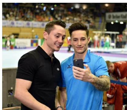
仲良しのマルセル・ニューエン選手と

【豆知識】 父親は元ルーマニア代表体操選手で、1989年にドイツに移住してからドイツ国内でも選手として活躍してきました。1994年、トーバ選手の父は、ドイツ全国選手権ハンブルク大会の個人総合で優勝しましたが、なんとその22年後の2016年、同じハンブルク大会で息子であるトーバ選手も個人総合で優勝しています。