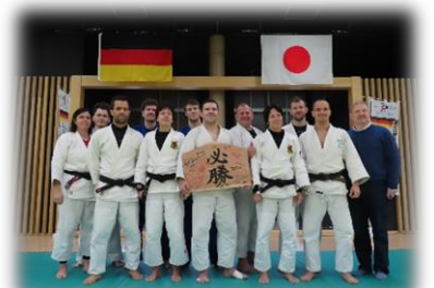
▲ドイツパラ柔道チームの合宿(県立武道館)