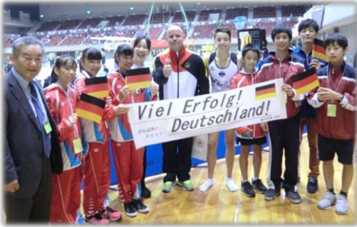
▲2017国際ジュニア体操競技大会への応援団派遣

また、ドイツパラリンピック柔道チームの合宿を2018年8月、2019年4月、2020年2～3月と3回受け入れ、地元選手との合同練習、学校訪問、日本文化体験等、幅広い交流を実施してきました。