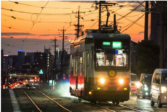
▲ 路面電車（東田坂上）

○市民から募集した豊橋のステキな景観写真 126 点を、市役所市民ギャラリー（R5.3.7～3.14）とこども未来館ココニコ（R5.3.17～3.28）で展示しました。