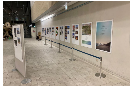
▲ こども未来館での展示会