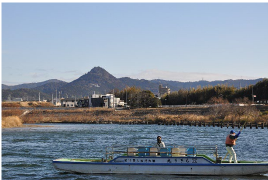
▲ 牛川の渡しと石巻山