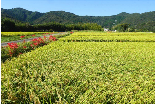
▲ 稔りの季節に船形山を望む（雲谷町）