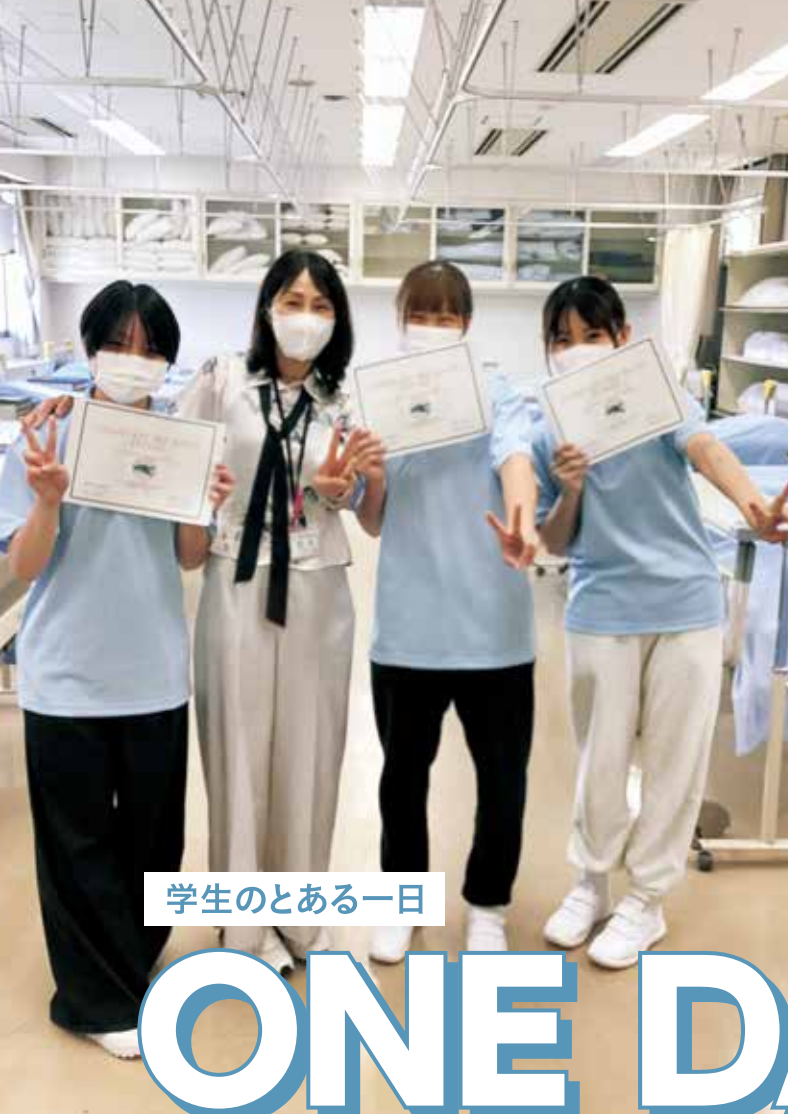
学生のとある一日